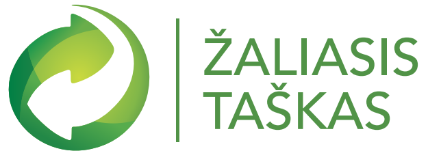
Pagrindinis logotipo naudojimo variantas