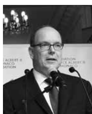
S.A.S. el Príncipe Alberto II de Mónaco

nuestra responsabilidad legar a las nuevas generaciones el poder vivir en un mundo sostenible”.