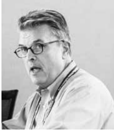
Craig McLean Científico jefe en funciones Administración Nacional Oceánica y Atmosférica (NOAA, por sus siglas en inglés) Estados Unidos de América

Soy responsable de la cartera de investigación de la NOAA que determina nuestras misiones en