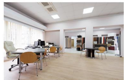
ショールームの来訪者対応