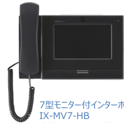
7型モニター付インターホン端末 IX-MV7-HB 本体希望小売価格 184,800円（税別）