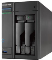
ネットワークレコーダー DS-2105 UHD オープン価格