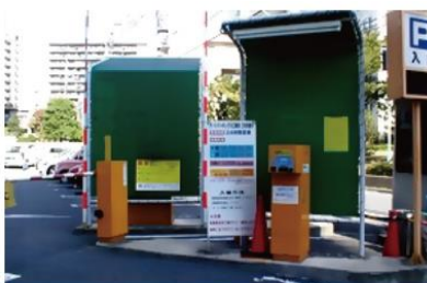
駐車場精算機の対応・記録