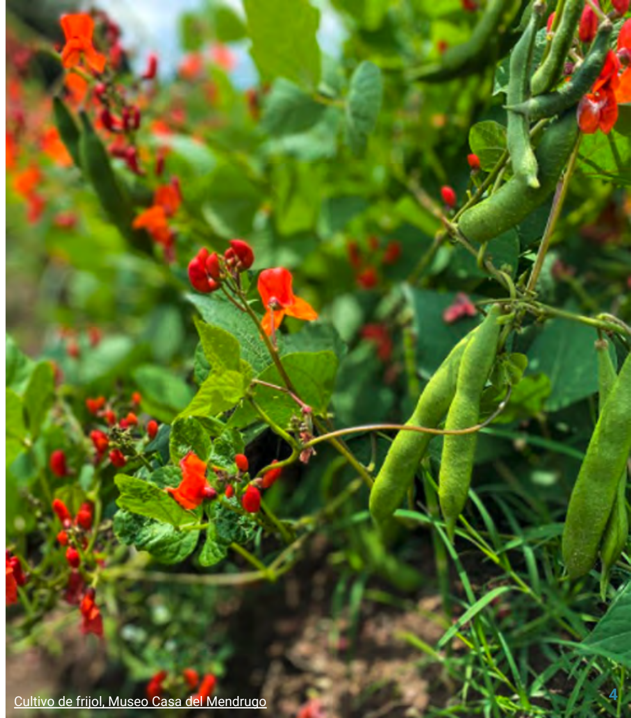
Cultivo de frijol, Museo Casa del Mendruqo

Los frijoles son uno de los alimentos autóctonos de México.