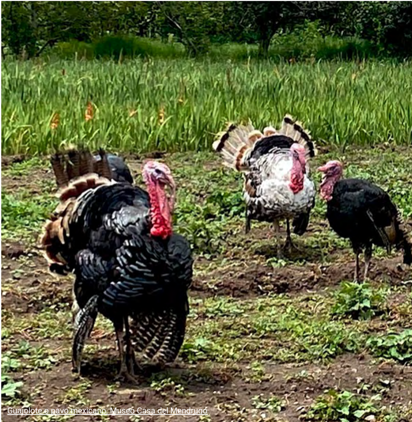
Guajolote o pavo mexicano, Museo Casa del Mendrugó