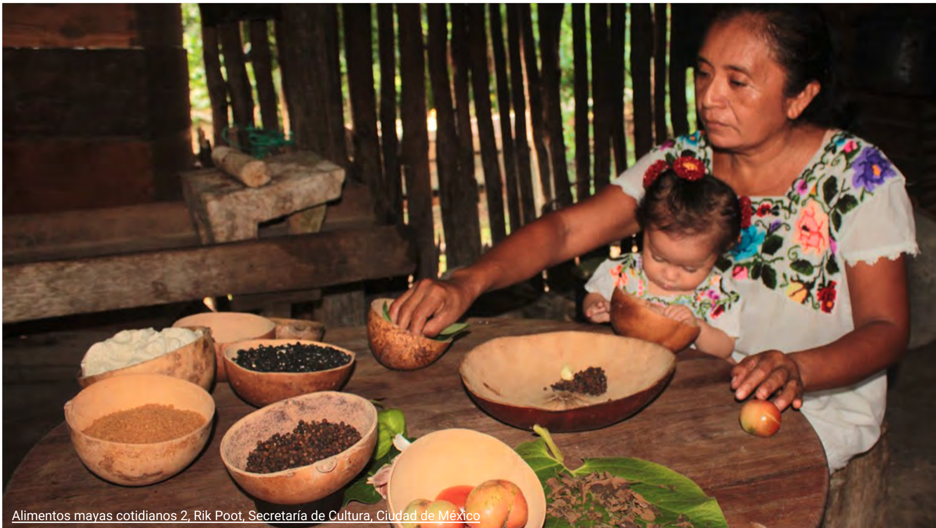
Alimentos mayas cotidianos 2, Rik Poot, Secretaría de Cultura, Ciudad de México

Como has leído, los pueblos indígenas de México tenían sus propias tradiciones culinarias mucho antes de que los europeos llegaran a América, trayendo nuevos ingredientes. En los antiguos pueblos del campo, muchas de estas tradiciones perviven hoy en día. La gente que vive allí protege sus tradiciones y educa a las siguientes generaciones sobre cómo seguir los procesos transmitidos a lo largo de la historia.