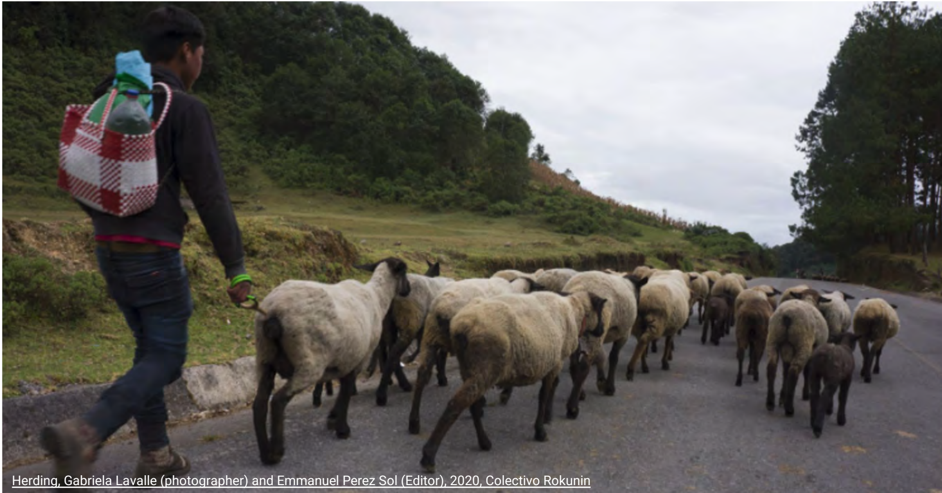
Herding, Gabriela Lavalle (photographer) and Emmanuel Perez Sol (Editor), 2020, Colectivo Rokunin

Al principio de este capítulo, has visto una foto de pavos (guajolotes) mexicanos. Esta es una de las aves autóctonas que aportaron proteínas a la dieta mexicana antes de la llegada de los europeos. Otras fuentes de proteínas eran el pescado y una variedad de insectos, algunos de los cuales se siguen comiendo hoy en día. Los europeos trajeron ganado vacuno, caprino, porcino y ovino cuando llegaron a América. Estos animales llegaron a México en el siglo XVI, alterando para siempre las fuentes de proteína que los pueblos nativos utilizaban para alimentarse.