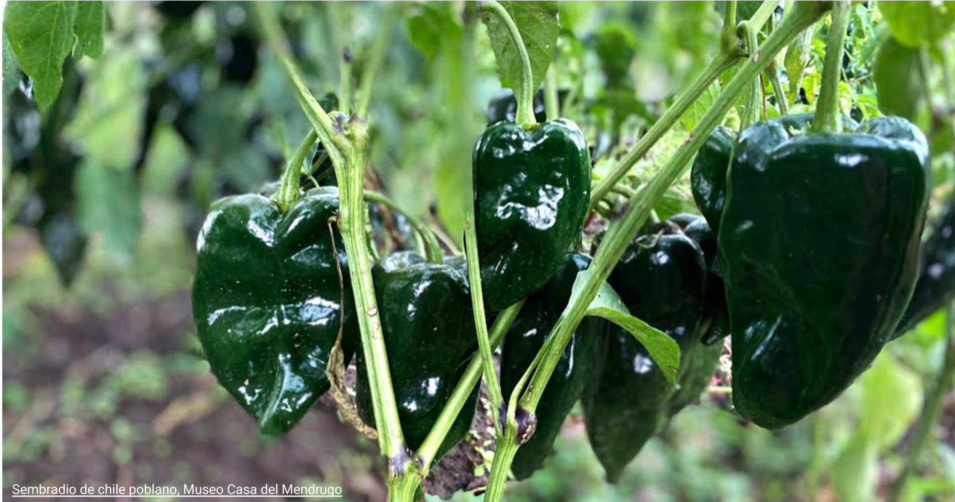
Sembradio de chile poblano, Museo Casa del Mendrugo

En México hay muchos tipos de chiles. Los chiles que se muestran aquí son poblanos. Los poblanos se utilizan en una gran variedad de platos en México. El nivel de picante de los poblanos varía, pero la mayoría son muy suaves. Los poblanos se suelen asar y rellenar. Cuando se seca, el poblano se conoce como chile ancho.