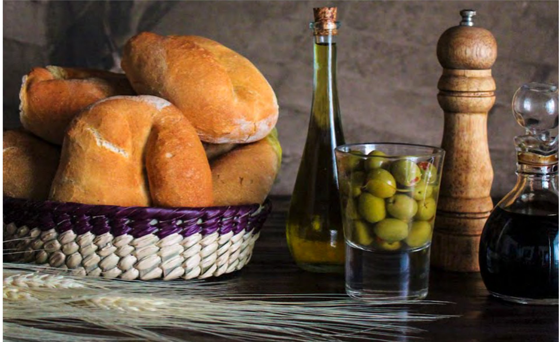
Bodegón, Museo casa del Mendruqo

Lee más sobre los ingredientes de la cocina mexicana y sus orígenes en esta historia .