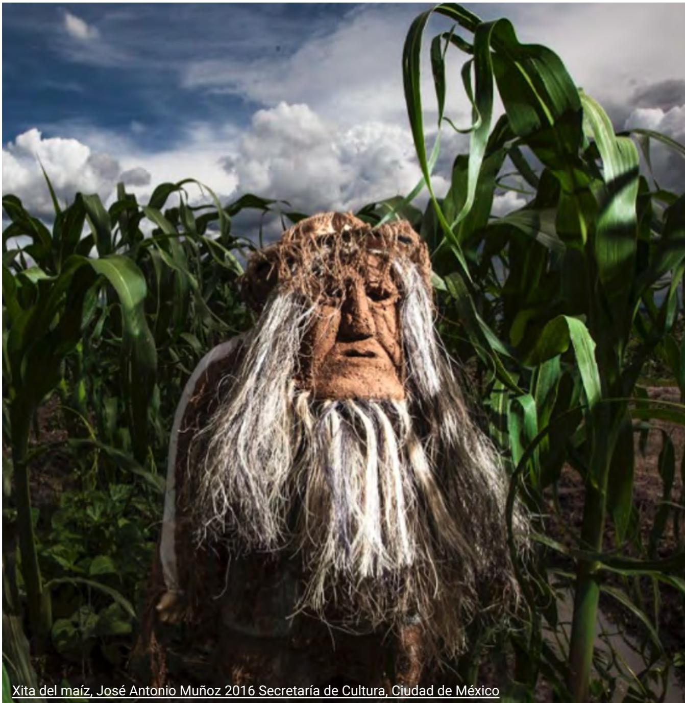
Xita del maíz, José Antonio Muñoz 2016 Secretaría de Cultura, Ciudad de México