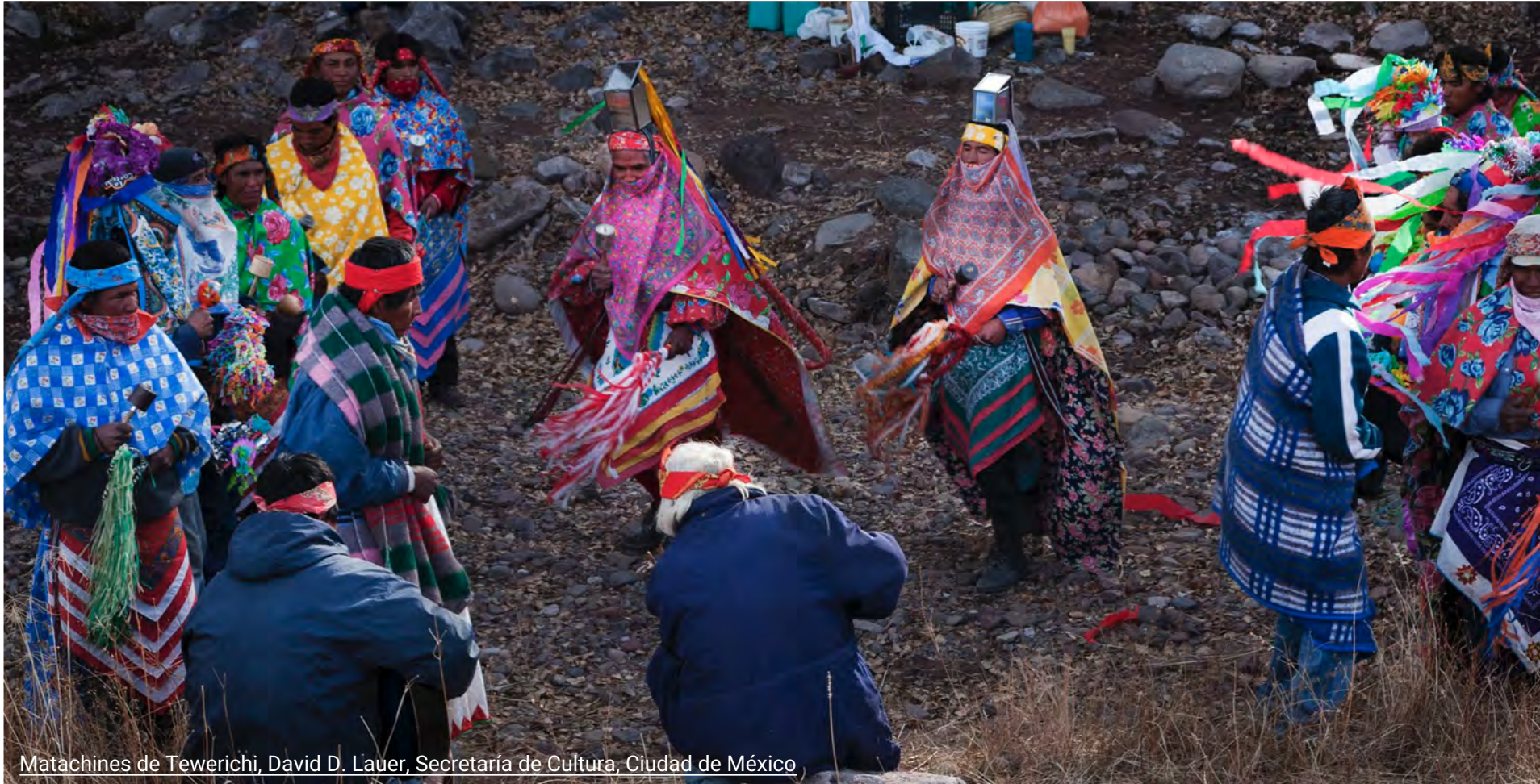
Matachines de Twerichi, David D. Lauer, Secretaría de Cultura, Ciudad de México

Para el pueblo Ralámuli, el maíz es el centro no sólo de su dieta sino también de sus rituales. Estos pueblos han cultivado el maíz durante miles de años, lo que ha dado lugar a muchas variedades de semillas. Creen que el cultivo y el consumo de maíz les permite comunicarse con sus dioses y también con los espíritus de sus antepasados.