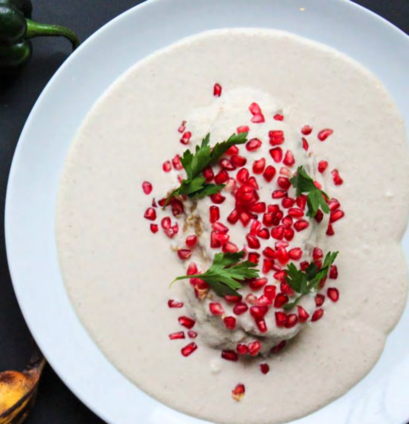
Chile en nogada y algunos de sus ingredientes, Museo Casa del Mendrugro