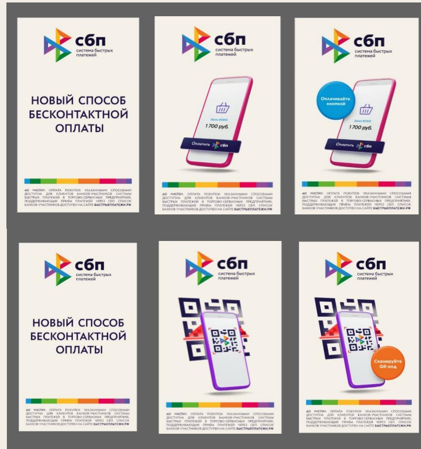
3. Ротация диджитал-баннеров с кнопкой и с QR-кодом

Анимуем луч, сканирующий QR-код и нажатие на кнопку