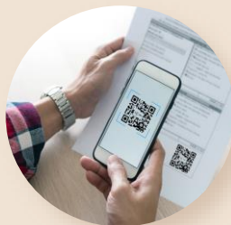
Квитанция на оплату