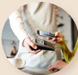
POS-терминал с QR-кодом