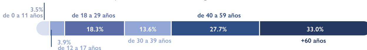
Ilustración 18. Distribución por grupo de edad de las personas que NO recibieron remesas regulares durante 2022