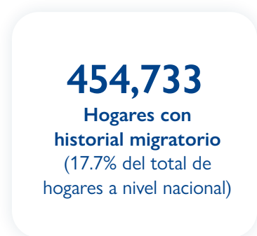
Ilustración 9. Hogares con historial migratorio (con personas emigrantes que solían ser miembros del hogar)