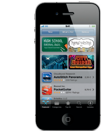
App Store je k dispozici ve vybraných zemích.