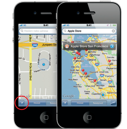
Google, logo Google a Google Maps jsou ochranné známky společnosti Google Inc. © 2010. Všechna práva vyhrazena.