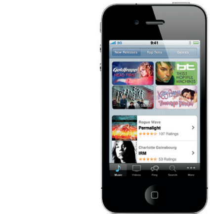
iTunes Store je k dispozici ve vybraných zemích.