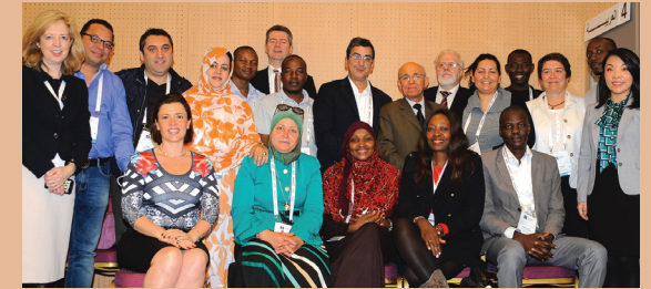
أعضاء AFRALO وأعضاء مجتمع At-Large في اجتماع ICANN55 في مراكش، مارس 2016.

خلال حملة توعوية واسعة النطاق، انضمت عدة بنى At-Large "ALSes" إلى منظمة At-Large لإقليم أفريقيا في السنوات الأخيرة. وأكثر من 44 من بنى ALSes يمثلون 25 دولة من المنطقة الأفريقية يشكلون منظمة At-Large لإقليم أفريقيا "AFRALO". وتعد بنى At-Large منظمات غير حكومية أو جمعيات تمثل مستخدمي الإنترنت المحليين أو نشطاء تقنية المعلومات والاتصالات بشكل عام. وهم يشاركون في بناء القدرات للمجتمعات المحرومة، وتعزيز البرمجيات الحرة والمفتوحة المصدر، وتطوير الثقافة والصحة والبيئة والتنمية البشرية بصفة عامة في القارة مستفيدين من الإنترنت في أنشطتهم.