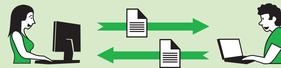
FORMATS OUVERTS, LOGICIELS DIFFÉRENTS

Pour que vos documents puissent être lus facilement par d'autres personnes, sans avoir besoin de vous soucier du logiciel qu'elles utilisent, choisissez des formats ouverts.