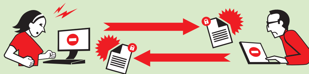
FORMATS FERMÉS, LOGICIELS DIFFÉRENTS

Alice utilise le logiciel « Carcera (1) ». Elle enregistre son rapport dans un format fermé (ne permettant pas l'interopérabilité), puis l'envoie à Bob qui possède le même logiciel. Celui-ci peut lire le document, le modifier et le renvoyer à Alice.